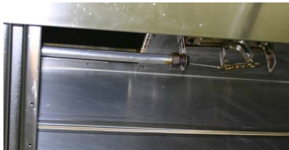
Küchenhaubenabluftkanal in der Heraeus Gastronomie: vor (Bild links) und 3.000 h nach der Installation (Bild rechts) der Heraeus UV-Lösung.